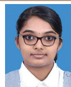
15. Shria Rajesj Rajesh Indian School, Muscot, Oman Board : CBSE