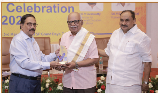
Sri Pazhani. A